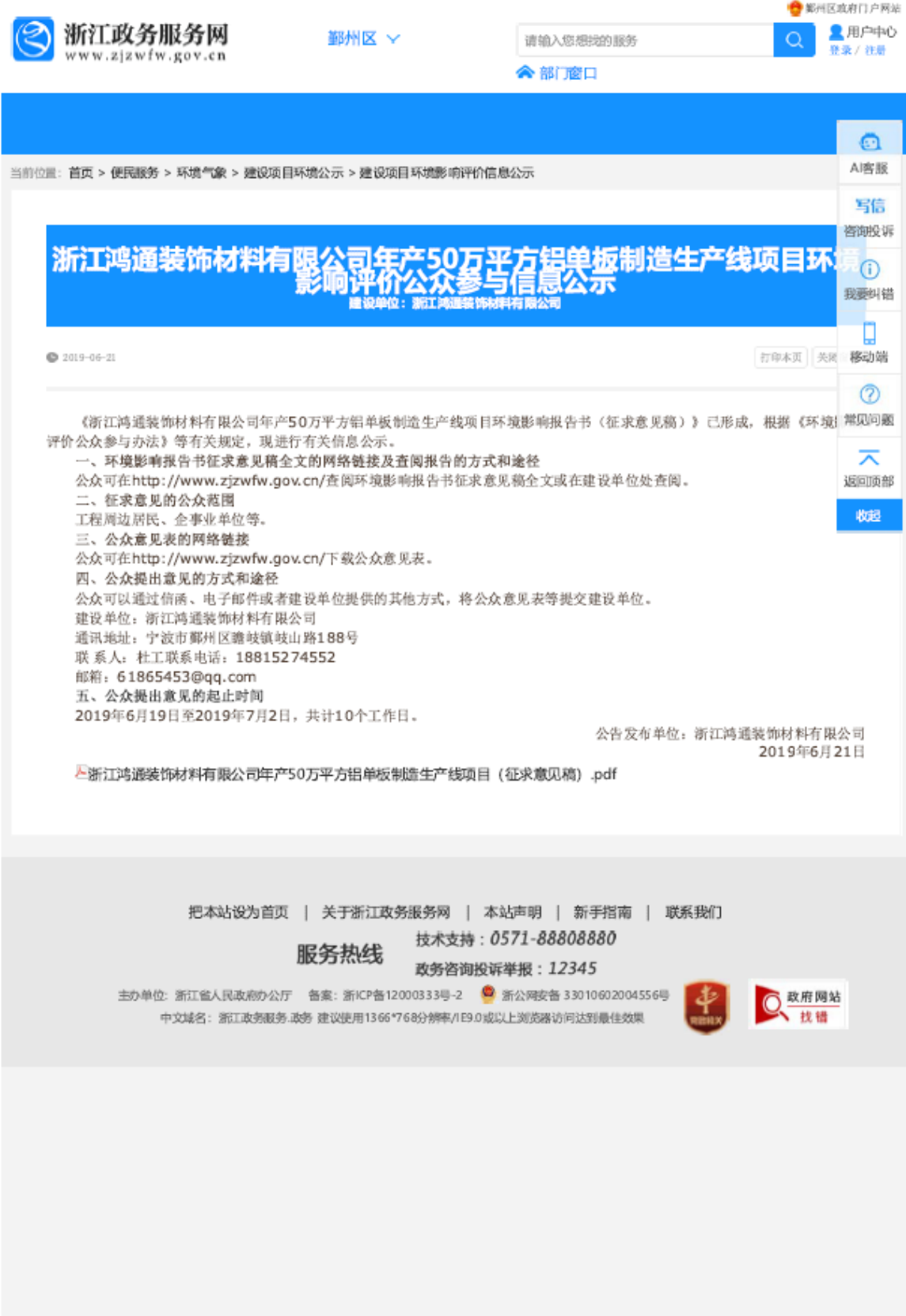
图 3-1 浙江省政务网征求意见稿公示